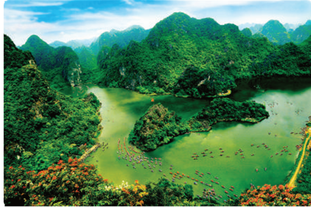
Hình 1.18. Một góc quần thể hang động Tràng An