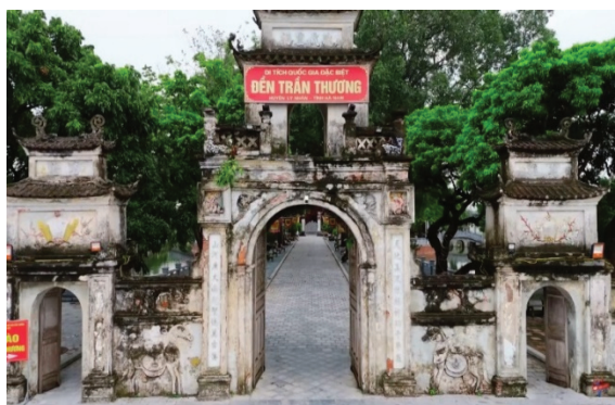
Hình 1.13. Nghi môn đền (xã Trần Thương)

Ngôi đền được xây dựng trên thế đất “hình nhân bái tướng” (tức là hình người), địa thế linh thiêng, hài hoà với thiên nhiên. Bố cục tổng thể gồm tam quan ngoại, sân đền, hệ thống cột đồng trụ, bình phong và khu nội tự. Tam quan được xây dựng bề thế, cửa chính hai tầng, tầng dưới cuốn vòm, tầng trên là gác chuông tám mái, trong treo chuông lớn. Hai cửa phụ trang trí hình ngựa, hoa sen; tường ngoài đắp voi châu, nghê châu, hoa văn truyền thống mang ý nghĩa cát tường.