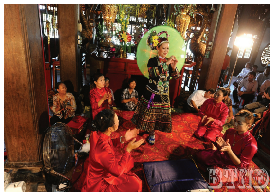
Hình 1.7. Nghi lễ hầu đồng tại Phủ Dầy (xã Vụ Bản)