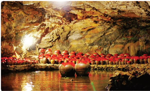
Hình 1.19. Hang Nấu Rượu (phường Tây Hoa Lư)