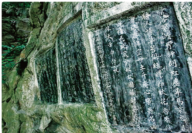
Hình 1.24. Một số bài thơ khắc trên vách núi Non Nước (phường Hoa Lư)