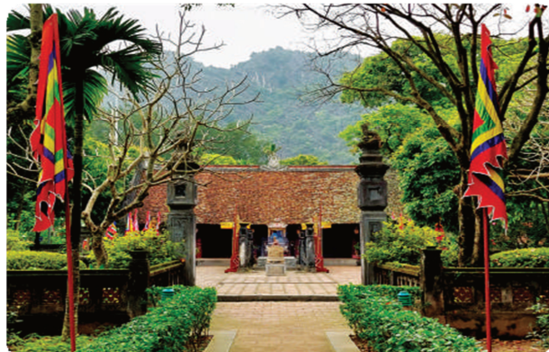
Hình 1.10. Đền thờ vua Lê Đại Hành (phường Tây Hoa Lư)

“Nước Cổ Việt ngang với nhà Tống niên hiệu Khai Bảo Kinh đô Hoa Lư như kinh đô Tràng An thời nhà Hán”.