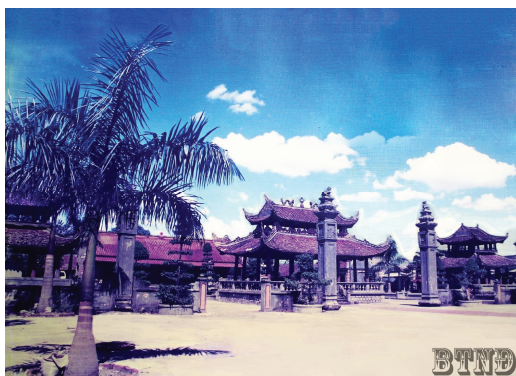
Hình 1.6. Phủ Tiên Hương thuộc quần thể di tích Phủ Dầy (xã Vụ Bản)

Phủ Dầy là quần thể di tích tín ngưỡng dân gian thuần Việt, được mệnh danh là “kinh đô” của Tín ngưỡng thờ Mẫu Tam phủ – một loại hình tín ngưỡng bản địa có sức sống mãnh liệt, đề cao hình tượng người Mẹ với khát vọng hướng thiện và sự bình an cho nhân thế. Giá trị của quần thể di tích không chỉ nằm ở hệ thống kiến trúc nghệ thuật đặc sắc, được Nhà nước xếp hạng là di tích cấp Quốc gia từ năm 1975 mà còn là di sản văn hoá phi vật thể đại diện của nhân loại (Thực hành tín ngưỡng thờ Mẫu Tam phủ của người Việt được UNESCO công nhận là di sản văn hoá phi vật thể đại diện của nhân loại vào năm 2016). Di tích gắn liền với sự tích về lần giáng sinh thứ hai của Thánh Mẫu Liễu Hạnh, một trong “Tứ bất tử” của tín ngưỡng dân gian Việt Nam.