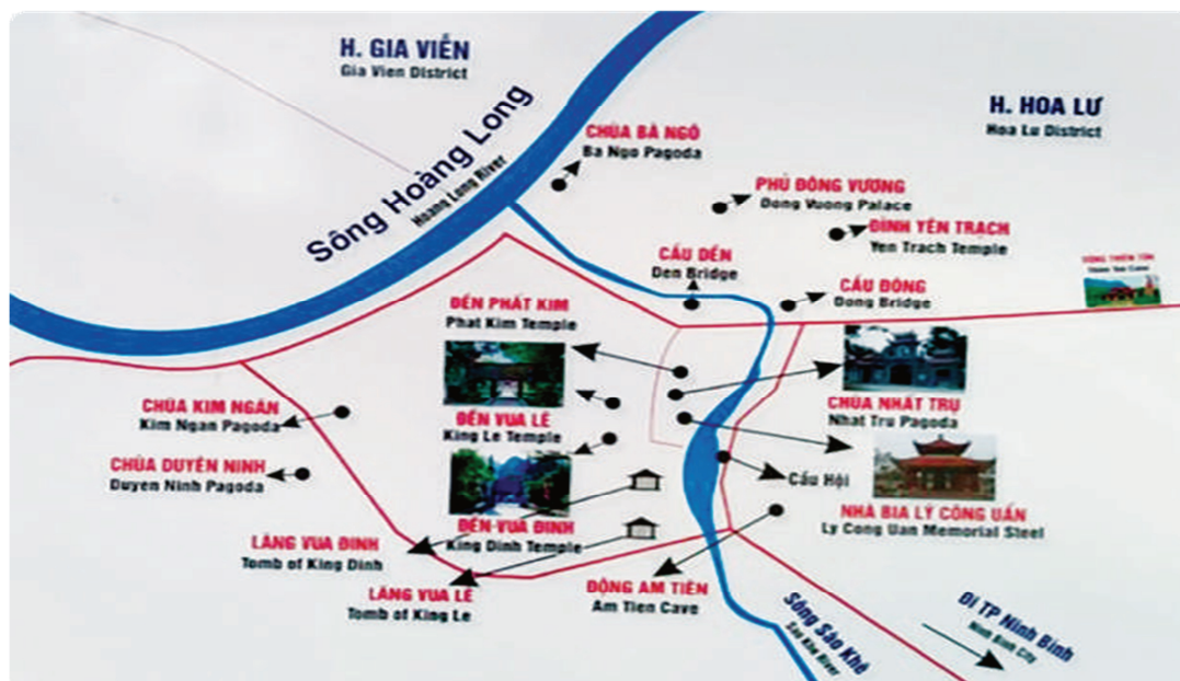
Hình 1.8. Sơ đồ khu di tích lịch sử và kiến trúc nghệ thuật Cổ đô Hoa Lư (phường Tây Hoa Lư)

động và một số công trình khác. Khu vực trung tâm của di tích chính là đền thờ vua Đinh Tiên Hoàng và đền thờ vua Lê Đại Hành. Các đền này được xây dựng trên nền cung điện xưa, ngay sau khi vua Lý Thái Tổ dời đô ra Đại La (Thăng Long), đều quay về hướng bắc. Từ thế kỉ XVII, hai đền thờ được xây dựng và trùng tu lại, quay về hướng đông như hiện tại.