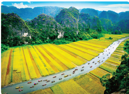
Hình 1.20. Đường vào Tam Cốc (phường Nam Hoa Lư)

Thắng cảnh Tam Cốc tọa lạc ở phường Nam Hoa Lư, tỉnh Ninh Bình. Tam Cốc có nghĩa là ba hang, gồm hang Cả, hang Hai và hang Ba. Giống như xuyên thủy động, dòng sông Ngô Đồng xuyên ngầm qua ba hang lớn trong khoảng cách gần nhau, tạo nên một kì quan của tạo hoá.