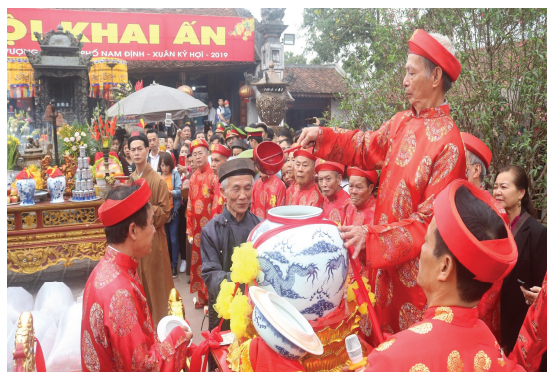
Hình 1.12. Lễ hội Khai ấn đền Trần (phường Nam Định)