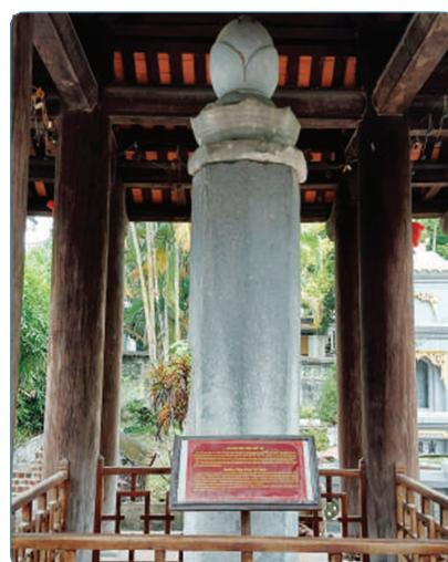
Hình 1.3. Cột kinh Phật chùa Nhất Trụ (phường Tây Hoa Lư)