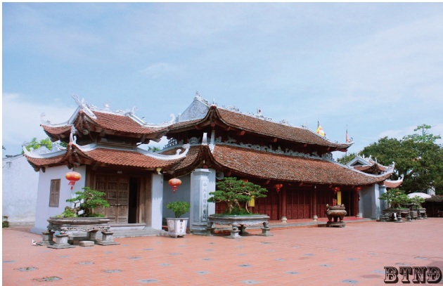
Hình 1.5. Phủ Vân Cát thuộc quần thể di tích Phủ Dầy (xã Vụ Bản)