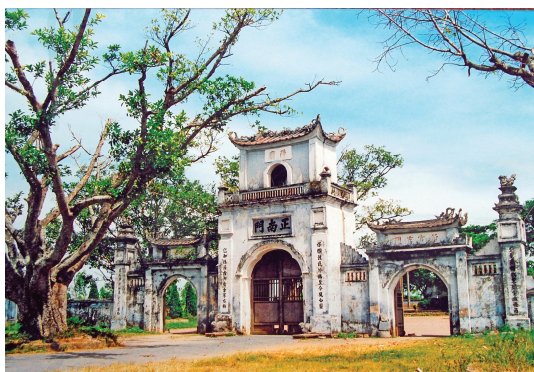
Hình 1.11. Cổng chính đền Trần (phường Nam Định)

– Đền Trùng Hoa được xây dựng trên nền cung Trùng Hoa xưa – nơi các đương kim hoàng đế nhà Trần về tham vấn các vị Thái thượng hoàng, được khánh thành năm 2000. Đây là nơi thờ 14 pho tượng các vua Trần đúc bằng đồng theo nguyên mẫu lịch sử.