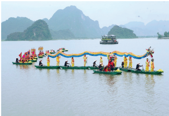
Hình 1.27. Lễ hội chùa Tam Chúc (phường Tam Chúc)

Bên cạnh giá trị thiên nhiên, Tam Chúc còn là một vùng đất cổ có bề dày lịch sử lâu đời: có nhiều di tích quan trọng như đình Tam Chúc, chùa Tam Chúc cổ; đền Mẫu; đền Giếng. Tại đó, thờ nhiều nhân nhân vật như: Đình Tiên Hoàng và Hoàng hậu Dương Thị Nguyệt, Lý Quốc Sư, Phật hoàng Trần Nhân Tông,... Các cuộc điều tra, khảo sát của Viện Khảo cổ học và Bảo tàng tỉnh Hà Nam (cũ) vào năm 2023 đã phát hiện khoảng 15 địa điểm khảo cổ học tại các hang động, mái đá và chân núi. Nhiều di tích thuộc văn hoá Hoà Bình có niên đại từ cuối thời kì đồ đá cũ đến đầu đồ đá mới như Hang Đội 4, Hang Tổ 8, mái đá Mỏ Sét; các di tích giai đoạn Đá mới – văn hoá Đa Bút và dấu ấn văn hoá Đông Sơn đã chứng minh Tam Chúc là nơi con người cư trú liên tục từ rất sớm.