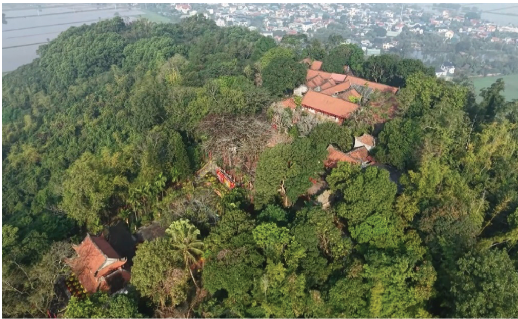
Hình 1.16. Toàn cảnh chùa Đọi Sơn (phường Tiên Sơn)

– Chùa Đọi Sơn hiện nay được xây dựng theo kiểu chữ đình bao gồm bảy gian tiền đường và ba gian thượng điện. Hệ thống vì kèo làm theo kiểu chồng đầu giá chiêng, cột cái đường kính 30 cm, chân kê đá cổ bông, xà và hoành vuông, mái lợp ngói ta. Xung quanh xây tường gạch, năm gian giữa nhà Tiền đường được lắp cánh cửa bức bàn bằng gỗ lim.