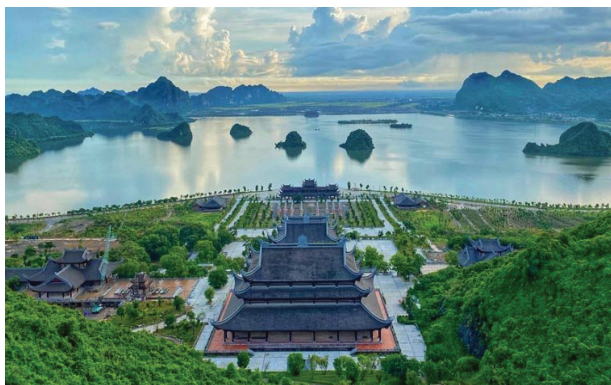
Hình 1.25. Toàn cảnh quần thể danh thắng Tam Chúc (phường Tam Chúc)