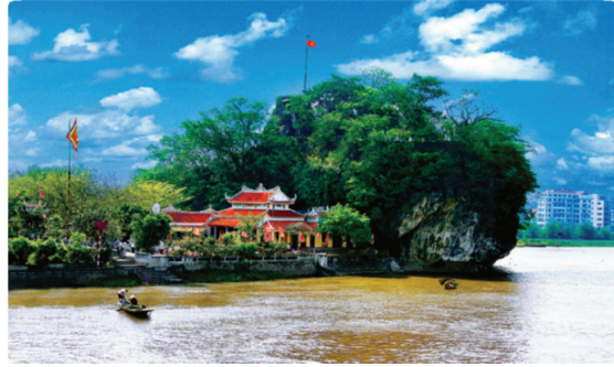
Hình 1.23. Núi Non Nước (phường Hoa Lư)

Ông là người đầu tiên lưu bút tích một bài thơ khắc vào núi đá, cũng là bài thơ “đặt tên” cho ngọn núi này (Dục Thuý sơn). Từ hàng trăm năm trước, núi Non Nước là nơi thường ngoạn và đề thơ của nhiều vị vua, danh nhân, thi sĩ nổi tiếng như Phạm Sư Mạnh, Nguyễn Trãi, Lê Thánh Tông, Lê Hiến Tông,... Hiện nay, với hơn 40 bài thơ còn lưu lại trên vách đá của các danh nhân, núi Non Nước còn được coi là “núi Thơ”, là một “bảo tàng” thơ bằng đá độc nhất vô nhị ở Việt Nam.