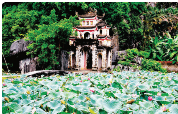
Hình 1.22. Chùa và động Bích Động (phường Nam Hoa Lư)

Di tích chùa và động Bích Động thuộc phường Nam Hoa Lư, tỉnh Ninh Bình, được mệnh danh là “Nam thiên đệ nhị động”. Di tích là sự kết hợp hài hoà giữa cảnh đẹp kì thú của hang động, núi non với sự tài hoa, khéo léo của con người.