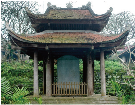
Hình 1.17. Nhà bia Sùng Thiện Diên Linh (phường Tiên Sơn)