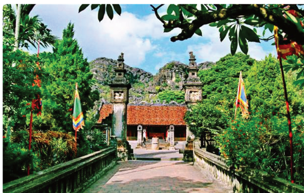
Hình 1.9. Đền thờ vua Đinh Tiên Hoàng (phường Tây Hoa Lư)