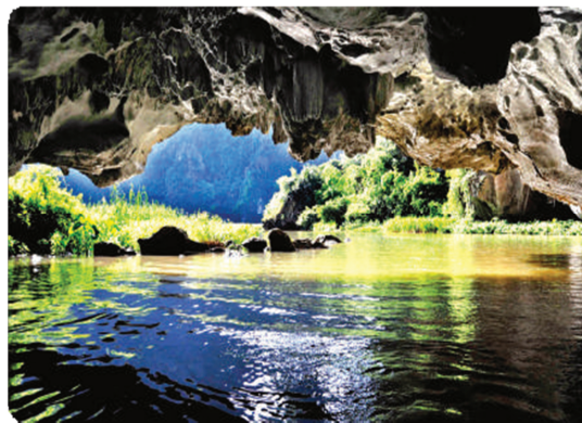
Hình 1.21. Hang Cả (phường Nam Hoa Lư)