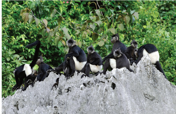
Hình 1.26. Voọc mông trắng tại vùng núi Tam Chúc (phường Tam Chúc)

Tam Chúc mang tính đại diện cho các quá trình sinh thái và sinh vật trong tiến hoá, là nơi cư trú của nhiều hệ sinh thái trên cạn và nước ngọt, có ý nghĩa quan trọng trong bảo tồn đa dạng sinh học. Đặc biệt, khu vực này là nơi sinh sống của quần thể Voọc mông trắng – loài linh trưởng quý hiếm bậc nhất thế giới với hơn 100 cá thể, cùng hàng trăm loài động vật khác, trong đó có 24 loài nằm trong sách đỏ Việt Nam và thế giới.