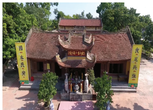
Hình 1.14. Mặt trước đền Trần Thương (xã Trần Thương)