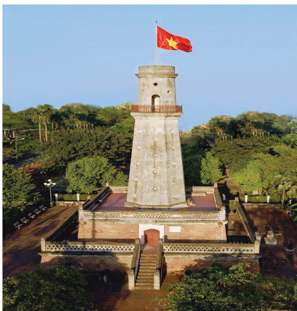
Hình 1.15. Toàn cảnh Cột cờ Nam Định (phường Nam Định)

Em có biết: Cột cờ Nam Định được khởi dựng năm 1812 (thời vua Gia Long), có tài liệu ghi là năm 1806 (thời vua Gia Long) và năm 1833 (thời vua Minh Mạng), hoàn thành năm 1843 (thời vua Thiệu Trị). Trải qua nhiều biến cố, đặc biệt là trận ném bom huỷ diệt của không quân Mỹ năm 1972 khiến cột cờ bị sụp đổ hoàn toàn. Đến năm 1997, công trình đã phục dựng lại nguyên trạng di tích trên nền cũ nhân kỉ niệm 43 năm ngày giải phóng thành phố Nam Định.