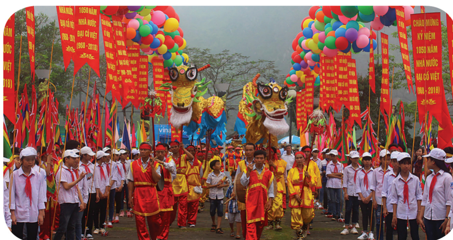
Hình 4.21. Lễ hội Hoa Lư

Ninh Bình là vùng đất có truyền thống lịch sử và văn hoá lâu đời, sở hữu nhiều loại hình di sản văn hoá phi vật thể đã được ghi nhận. Tiêu biểu trong số đó là tín ngưỡng thờ Mẫu – nét văn hoá đặc sắc của vùng đồng bằng Bắc Bộ. Ngoài ra, địa phương còn nổi bật với Lễ hội Hoa Lư gắn liền với cố đô Hoa Lư, cùng các loại hình nghệ thuật dân gian như hát văn, hát chèo và hát xẩm.