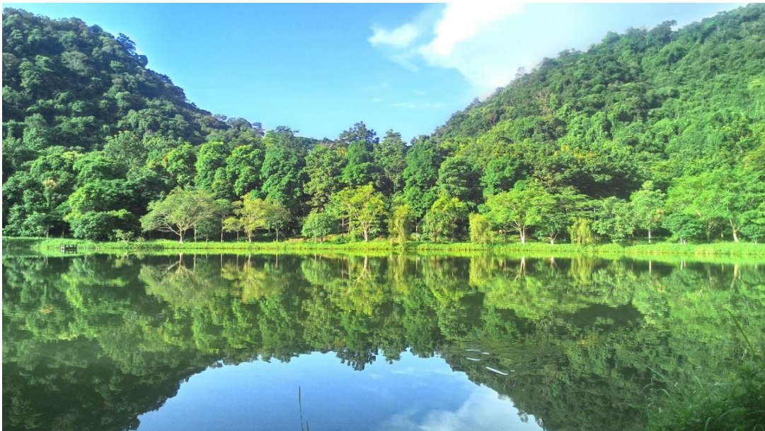
Hình 4.22. Vườn quốc gia Cúc Phương

Ninh Bình sở hữu nhiều giá trị tự nhiên đặc biệt như Vườn quốc gia Cúc Phương – vườn quốc gia đầu tiên của Việt Nam và Vườn quốc gia Xuân Thủy – khu Ramsar đầu tiên của Việt Nam cũng như của toàn Đông Nam Á. Vườn quốc gia Xuân Thủy được UNESCO xác định là vùng lõi có tầm quan trọng đặc biệt trong Khu Dự trữ sinh quyển thế giới về đất ngập nước ven biển châu thổ sông Hồng.