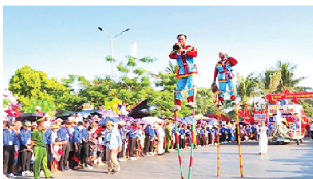
Hình 1.18. Trò chơi đi cà kheo

Trò chơi đi cà kheo ở Ninh Bình là một nét văn hoá dân gian đặc sắc, phổ biến trong các lễ hội truyền thống, đặc biệt là ở các vùng có đồng bào Mường và vùng biển (Hải Hậu, Nghĩa Hưng),... Trò chơi đi cà kheo là một trò chơi đòi hỏi người chơi phải lấy được thế cân bằng, có bước đi chính xác, sức khoẻ tốt, kết hợp nhịp nhàng cả chân lẫn tay. Để làm chủ được đôi cà kheo cũng đòi hỏi một khoảng thời gian tập luyện nhất định, dài hay ngắn tùy theo sự khéo léo của mỗi người. Các cuộc thi và trò chơi đi cà kheo thường tạo được tiếng cười sảng khoái cho khán giả bởi sự hấp dẫn, bất ngờ của trò chơi.