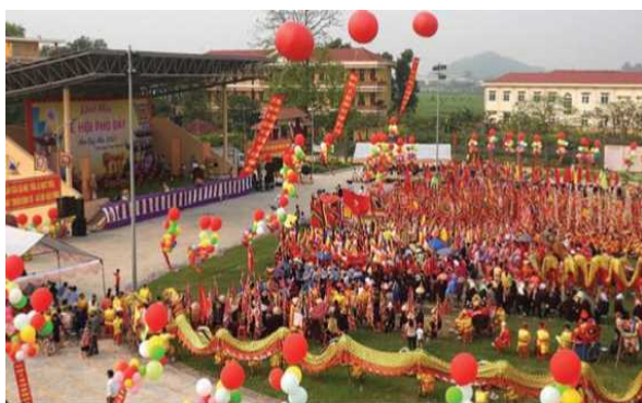
Hình 1.11. Lễ hội Phủ Dầy

Quần thể di tích Phủ Dầy thuộc xã Vụ Bản, tỉnh Ninh Bình, được coi là trung tâm của tín ngưỡng thờ Mẫu Tam phủ ở Việt Nam.