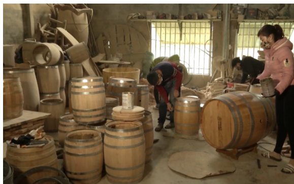
Hình 1.5. Nghề trống Tiên Sơn

Hệ thống di sản văn hoá phi vật thể của Ninh Bình là kết tinh sinh động của đời sống tinh thần phong phú, trí tuệ và óc sáng tạo của cộng đồng cư dân nơi đây qua hơn một thiên niên kỉ hình thành, đấu tranh và phát triển quê hương, đất nước. Trong đó, nhiều di sản mang tính đại diện cao, có giá trị đặc sắc, phản ánh rõ nét sự kế tục và lan toả liên tục giữa các thế hệ, tiêu biểu như Lễ hội Báo Bản làng Nộn Khê, Lễ hội Tịch điền Đọi Sơn, Lễ hội vật võ Liễu Đôi,... Đồng thời, không ít di sản giữ vai trò quan trọng trong đời sống văn hoá hiện nay, sở hữu tiềm năng phát triển lâu dài và đang được ưu tiên bảo tồn, phát huy, bao gồm các loại hình nghệ thuật dân gian như hát xẩm, hát chèo, ca trù; các trò chơi, sinh hoạt truyền thống như ném còn, cà kheo, đẩy gậy; các nghề thủ công và ẩm thực đặc trưng như gốm Bồ Bát, sơn mài Cát Đằng, nghề làm nem Yên Mạc cùng hệ tri thức dân gian về Phở tỉnh Ninh Bình.