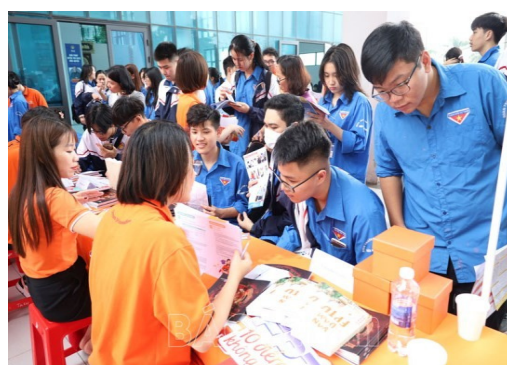
Hình 5.4. Ngày hội tư vấn hướng nghiệp, tuyển sinh và giải quyết việc làm năm 2020 do Sở Lao động, Thương binh và Xã hội, Sở Giáo dục và Đào tạo và Tỉnh Đoàn phối hợp tổ chức