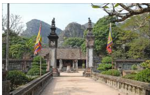
Hình 1.9. Đền thờ vua Đinh Tiên Hoàng