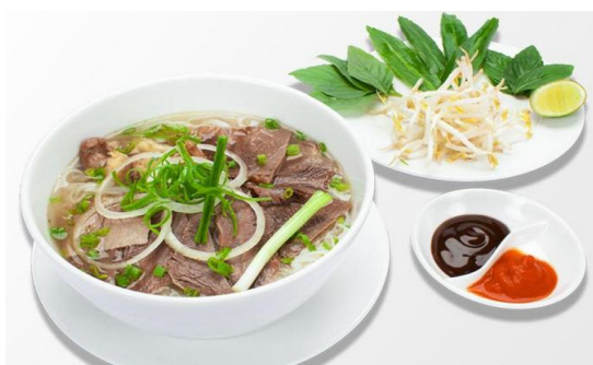
Hình 2.11. Phở bò