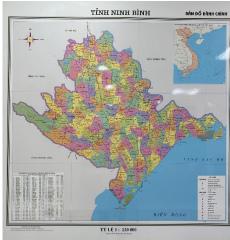
Hình 4.1. Bản đồ hành chính tỉnh Ninh Bình

Tỉnh Ninh Bình có diện tích tự nhiên 3 942,6 km 2 , quy mô dân số 4 412 264 người, chính thức được thành lập từ ngày 01/7/2025 trên cơ sở sáp nhập 3 tỉnh Hà Nam, Nam Định và Ninh Bình. Tỉnh có địa hình đa dạng: phía tây là khu vực đồi núi đá vôi, tiếp đến là dải đồng bằng phù sa, phía đông là vùng đồng bằng duyên hải ven biển. Tài nguyên thiên nhiên phong phú tạo cơ hội thúc đẩy phát triển kinh tế – xã hội, song cũng đặt ra thách thức lớn về bảo vệ môi trường.