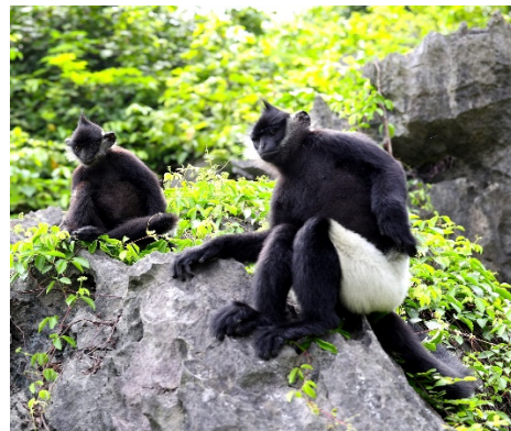
Hình 4.6. Voọc mông trắng tại núi Ba Sao, phường Tam Chúc

Bên cạnh các loài động, thực vật hoang dã, tỉnh còn chú trọng bảo tồn đa dạng nguồn gen vật nuôi, cây trồng, đặc biệt là các giống đặc sản của mỗi địa phương, góp phần phát triển nông nghiệp sinh thái bền vững.