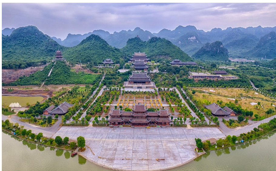
Hình 4.20. Chùa Tam Chúc

Tràng An. Ngoài ra, Ninh Bình còn có hệ thống làng nghề thủ công truyền thống với các sản phẩm OCOP đặc trưng.