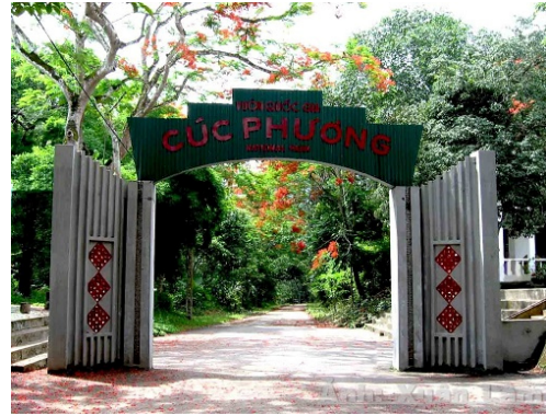
Hình 4.5. Vườn quốc gia Cúc Phương

Rừng ngập mặn phân bố ở các xã ven biển với tổng diện tích khoảng 3 200 ha. Ngoài tác dụng chắn sóng, chắn gió bão, bảo vệ đê, hạn chế sạt lở bờ biển, rừng còn giúp điều hoà khí hậu, bảo tồn đa dạng sinh học và nguồn lợi thuỷ sản.