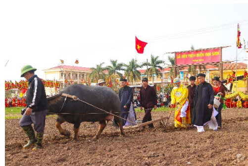
Hình 4.2. Lễ hội Tịch điền Đọi Sơn

Vùng đồng bằng với phần lớn diện tích là đất sản xuất nông nghiệp, trong đó diện tích đất trồng lúa đạt 148 114 ha (chiếm 37,5 % diện tích tự nhiên). Đây là nơi sản xuất lương thực trọng điểm của tỉnh và khu vực. Ngoài ra có 16 985 ha đất trồng cây hàng năm khác và 21 877 ha đất trồng cây lâu năm.