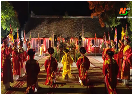
Hình 1.12. Lễ tế Cửu khúc tại Lễ hội Hoa Lư