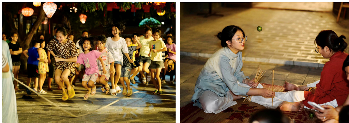
Hình 1.23. Trẻ em Ninh Bình tham gia các trò chơi dân gian tại Phố cổ Hoa Lư

Việc bảo tồn và phát huy giá trị các di sản văn hoá phi vật thể tại tỉnh Ninh Bình cần được triển khai rộng rãi trong các nhà trường phổ thông, giúp thế hệ trẻ hiểu rõ giá trị truyền thống độc đáo của văn hoá địa phương và tham gia tích cực vào quá trình thực hành, bảo lưu và phát huy giá trị di sản trong thời đại mới.