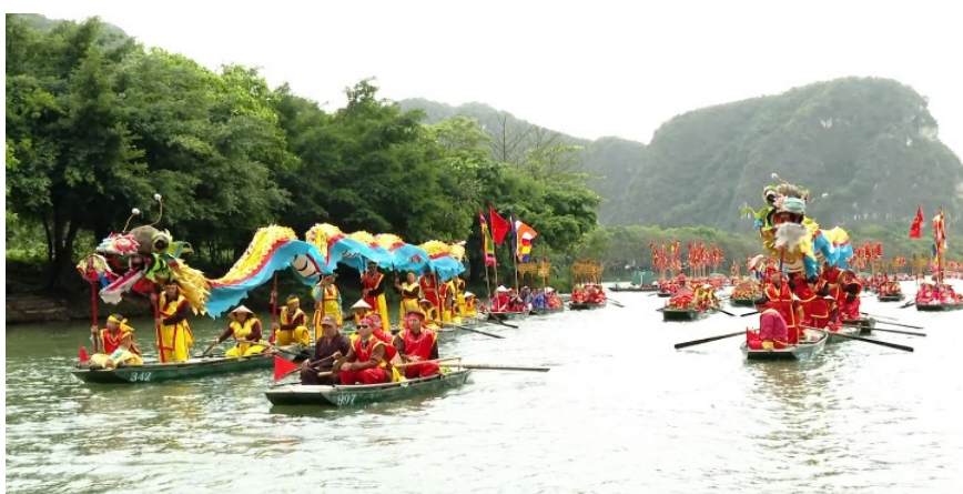
Hình 4.15. Nghi thức rước rồng trên sông Sào Khê tại lễ hội Tràng An

Bên cạnh đó, tăng trưởng xanh còn có vai trò quan trọng trong bảo tồn di sản thiên nhiên và văn hoá của tỉnh. Ninh Bình là nơi có Quần thể danh thắng Tràng An – di sản văn hoá và thiên nhiên thế giới; có khu sinh thái và dự trữ sinh quyển ven biển Xuân Thủy và có nhiều di tích lịch sử, làng nghề truyền thống lâu đời. Việc phát triển du lịch sinh thái, du lịch xanh giúp khai thác hợp lý các giá trị di sản, đồng thời bảo vệ cảnh quan, hệ sinh thái và bản sắc văn hoá địa phương. Qua đó, các di sản không chỉ được gìn giữ mà còn trở thành nguồn lực quan trọng cho phát triển kinh tế – xã hội lâu dài của tỉnh.