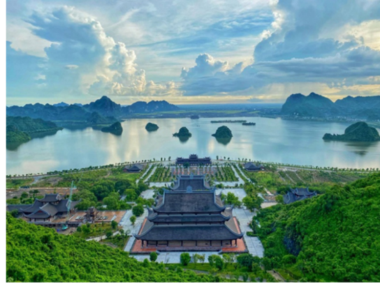
Hình 4.10. Quần thể chùa Tam Chúc

Quan sát hình 4.9 và hình 4.10, theo em, vì sao chúng ta cần bảo vệ cảnh quan và môi trường khi phát triển du lịch ở những nơi này?