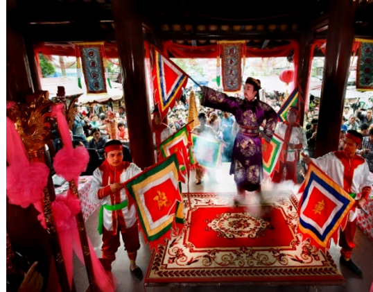
Hình 2.7. Tín ngưỡng thờ Mẫu – Lễ hội Phủ Dầy