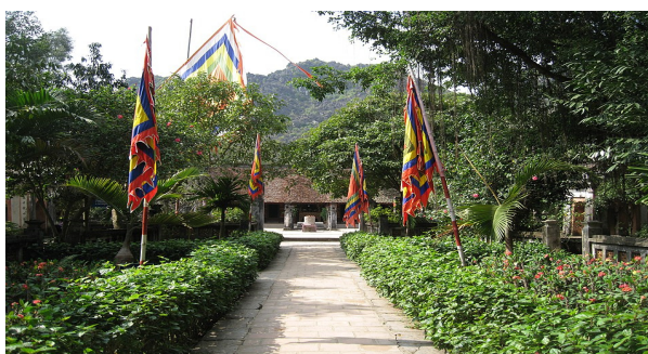
Hình 1.10. Đền thờ vua Lê Đại Hành