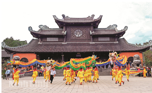
Hình 1.3. Rước Rồng tại Lễ hội chùa Bái Đính