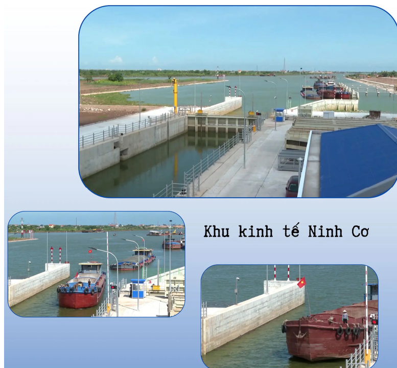
Khu kinh tế Ninh Cơ