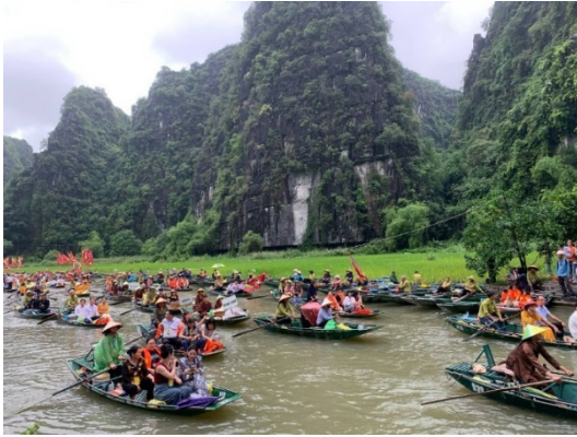
Hình 4.9. Khu du lịch Tam Cốc