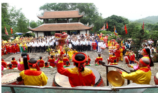
Hình 1.15. Lễ hội chùa Long Đọi Sơn