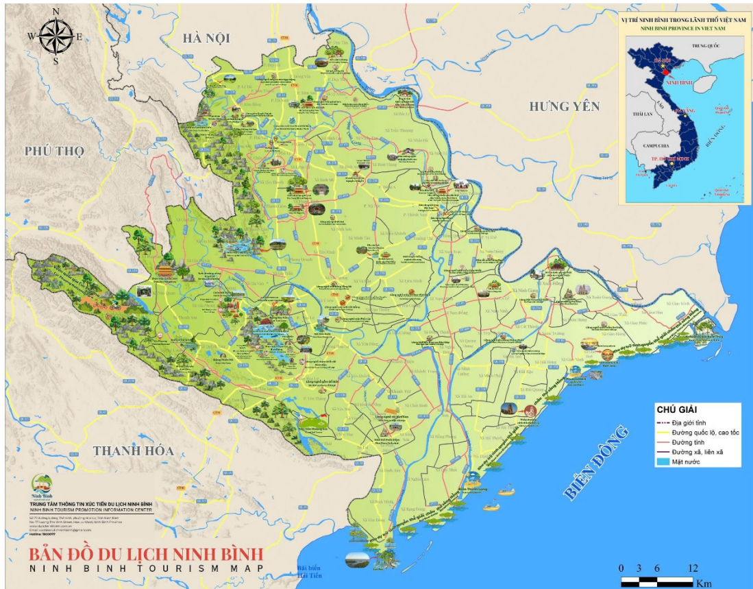
Hình 2.12. Bản đồ du lịch tỉnh Ninh Bình