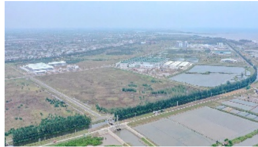
b. Hàng rào cây phi lao 17 km bao quanh Khu công nghiệp