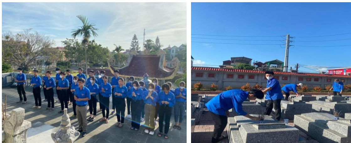
Hình 5.5. Học sinh Trường THPT C Kim Bảng tham gia hoạt động dâng hương tại Đài tưởng niệm Liệt sĩ phường Kim Bảng