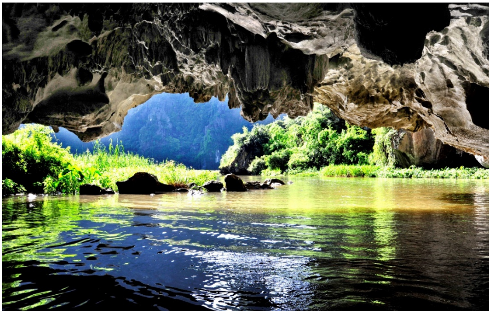
Hình 2.2. Hang động Tam Cốc (phường Hoa Lư)

– Vùng đồng bằng và ven biển: Chiếm phần lớn diện tích tỉnh, bao gồm đồng bằng phù sa sông và đồng bằng duyên hải Kim Sơn, Giao Thủy, Hải Hậu đang được bồi tụ, tạo thuận lợi cho du lịch biển và tham quan cánh đồng.