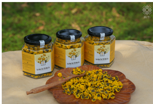
Hình 1.22. Trà Sơn Kim Cúc

+ Trà Sơn Kim Cúc là một loại chè nổi tiếng từ xưa được làm bằng hoa cúc vàng trên núi Non Nước, nên gọi là trà Sơn (núi) Kim Cúc (cúc vàng). Hiện nay, loại chè này được trồng và chế biến phổ biến ở các thôn thuộc phường Nam Hoa Lư. Cây trà Sơn Kim Cúc rất thích hợp với đất núi do mưa chảy xuống các thung, có thể trồng bằng gốc hay cành đều được. Để sao chế, người ta hái hoa cúc về sao tươi cho tái rồi phơi khô, sau đó đóng gói. Loại trà này không có nhiều vì thiếu đất hợp để trồng, mỗi ấm chỉ dùng 15 đến 20 nụ hoa là đã có ấm trà ngon.