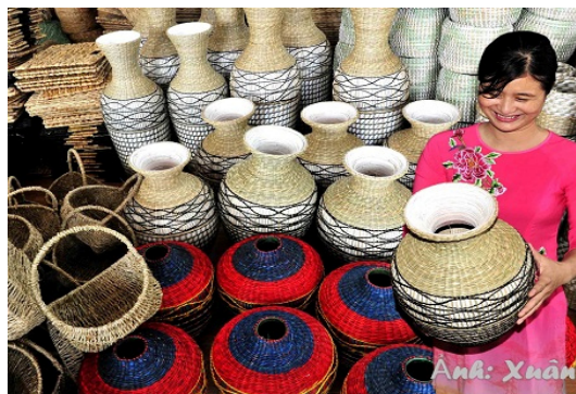
Hình 1.6. Nghề cói Kim Sơn