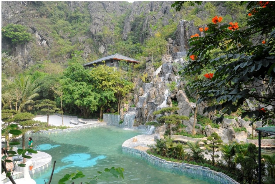
Hình 2.3. Suối nước nóng Kênh Gà (xã Gia Viễn)

– Nước khoáng nóng: Một tài nguyên đặc biệt có giá trị du lịch nghỉ dưỡng, chữa bệnh là suối nước nóng Kênh Gà và suối Thường Sung.