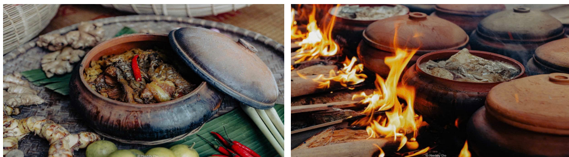
Hình 1.19. Thành phẩm của cơ sở cá kho Trần Xuân Thực (xã Nam Lý)

Cơ cấu bữa ăn của người dân Ninh Bình khá phong phú về cách chế biến, tạo nên những món ăn đặc trưng như món mắm tươi: “Mắm tươi nước cất, đo vật ba năm”, món cá trắm kho tộ: “Ăn cá trắm, uống rượu tầm, vật trắm trện”. Các món ăn dân dã, bình dị, ăn ngon và dễ làm, có tác dụng bồi bổ sức khoẻ. Điều đó vừa nói lên sự phong phú, đa dạng của món ăn, lại vừa thể hiện phong vị riêng biệt trong từng món.