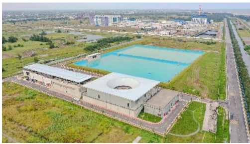
c. Hệ thống xử lý nước cấp