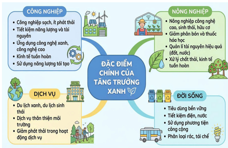
Hình 4.12. Đặc điểm chính của tăng trưởng xanh

Tăng trưởng xanh có những đặc điểm chính sau: