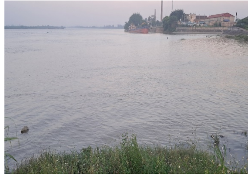
Hình 4.4. Cửa Hữu Bị – nơi sông Châu Giang chảy ra sông Hồng

Tỉnh có nguồn tài nguyên nước phong phú với tổng trữ lượng nước mặt khoảng 100,5 tỉ m 3 /năm; có mạng lưới sông ngòi dày đặc với mật độ 1,0 – 1,3 km/km 2 . Tổng chiều dài các con sông là 1 599,1 km bao gồm các sông lớn như sông Hồng, sông Đáy và các sông nội tỉnh. Nhờ đó, nguồn nước cơ bản đáp ứng nhu cầu sinh hoạt, sản xuất nông nghiệp và các hoạt động kinh tế – xã hội.