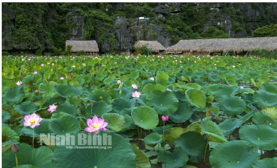
Hình 4.17. Sen ở Hang Múa, Ninh Bình

Ninh Bình xây dựng mô hình nông nghiệp kết hợp với du lịch sinh thái có tiềm năng phát triển, tạo ra sản phẩm nông nghiệp chất lượng cao phục vụ du khách và thị trường, vừa nâng cao giá trị nông sản, vừa tạo việc làm tại chỗ cho người dân, thu hút hàng triệu lượt khách du lịch mỗi năm.