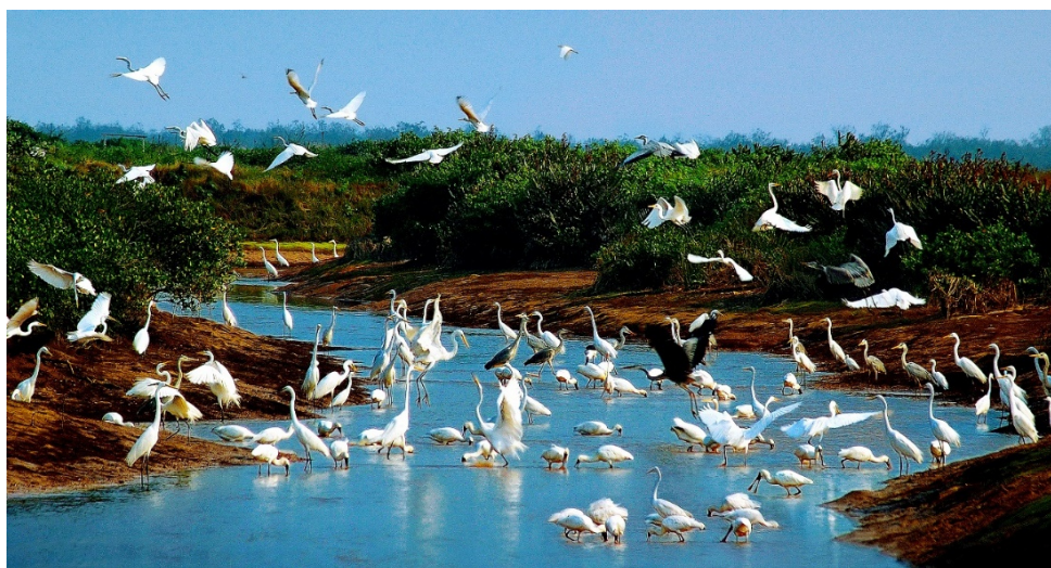
Hình 2.4. Sân chim Vườn quốc gia Xuân Thủy (xã Giao Minh)