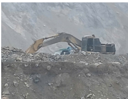
Hình 4.3. Mở khai thác đá vôi Hồng Sơn, phường Lý Thường Kiệt

Ngoài ra, tỉnh còn một số khoáng sản khác. Trong đó, có nguồn nước khoáng nóng tại Kênh Gà, khu vực Cúc Phương giúp phát triển du lịch nghỉ dưỡng. Để bảo tồn nguồn tài nguyên, giảm ô nhiễm, bảo vệ cảnh quan, việc khai thác khoáng sản cần tuân thủ quy hoạch và áp dụng công nghệ phù hợp.