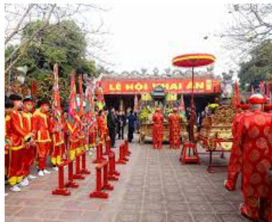
Hình 1.1. Một số di sản văn hoá phi vật thể của tỉnh Ninh Bình