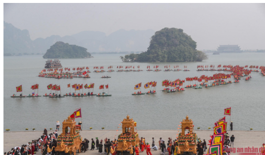
Hình 1.4. Khung cảnh lễ khai hội chùa Tam Chúc