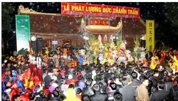
Hình 1.2. Lễ hội phát lương Đền Trần Thương (xã Trần Thương)

Di sản văn hoá phi vật thể ở Ninh Bình là hệ thống các giá trị tinh thần được hình thành trong quá trình lịch sử, gắn liền với đời sống của các cộng đồng dân tộc cư trú lâu đời trên địa bàn tỉnh. Những di sản này phản ánh trình độ sáng tạo, bản sắc văn hoá đặc trưng của con người Ninh Bình và được nhân dân gìn giữ, lưu truyền, bảo tồn, phát huy qua nhiều thế hệ.