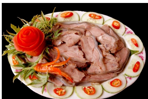
Hình 2.10. Đặc sản dê núi

Ẩm thực của tỉnh Ninh Bình đa dạng, mang đậm hương vị vùng đồng bằng Bắc Bộ, nổi bật là các món ăn từ dê núi, cơm cháy, nem, bún truyền thống và các đặc sản địa phương khác. Đặc biệt, Ninh Bình được xem là một trong những cái nôi của phở Việt. Nước dùng trong, ngọt thanh từ xương bò ninh kĩ, sợi phở nhỏ, mềm và bánh phở trắng mỏng đặc trưng. Hương vị đậm đà, tinh tế của phở bò nơi đây đã góp phần làm nên thương hiệu ẩm thực riêng của vùng đất cố đô.