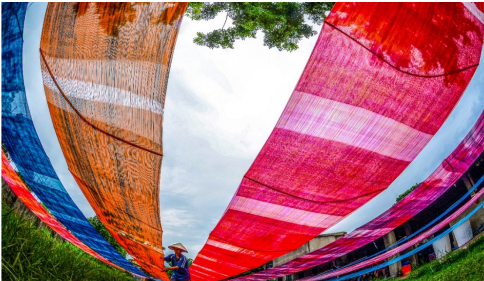
Hình 2.8. Làng lụa Nha Xá (xã Mộc Hoàn)