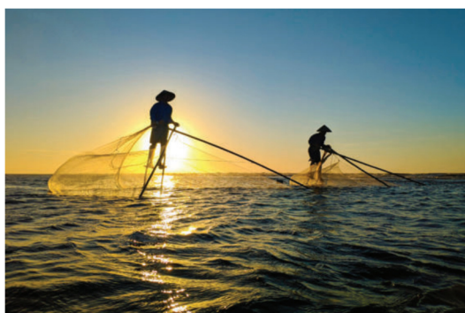
Hình 4.7. Khai thác hải sản tại xã Hải Lý

Tuy nhiên, môi trường biển cũng đang đối mặt với thách thức từ biến đổi khí hậu, nước biển dâng. Sự gia tăng mật độ phương tiện khai thác và việc áp dụng các phương thức sản xuất thiếu bền vững đã gây ô nhiễm môi trường, làm biến đổi chuỗi thức ăn, suy giảm nguồn lợi tự nhiên và đe dọa đa dạng sinh học, đặc biệt là tại khu vực ven bờ. Thực trạng đó đòi hỏi các giải pháp bảo tồn và khai thác bền vững.