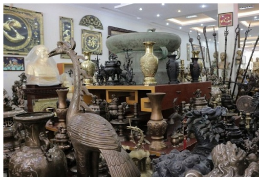
Hình 1.8. Nghề đúc đồng Yên Xá

Thế nào là di sản văn hoá phi vật thể? Kể tên các loại hình di sản văn hoá phi vật thể tiêu biểu ở tỉnh Ninh Bình.