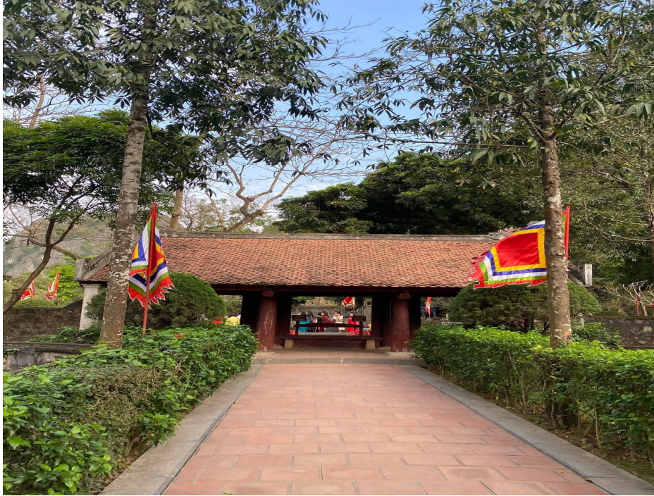
Hình 2.5. Khu di tích lịch sử – văn hoá Cố đô Hoa Lư (phường Tây Hoa Lư)