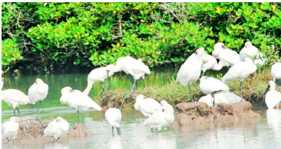
Hình 4.13. Một góc Vườn quốc gia Xuân Thủy (xã Giao Minh) – Mô hình du lịch sinh thái của tỉnh Ninh Bình

Tăng trưởng xanh giúp tỉnh Ninh Bình phát triển kinh tế theo hướng bền vững và hiệu quả hơn. Trong nông nghiệp, việc áp dụng mô hình nông nghiệp sạch, nông nghiệp hữu cơ, kinh tế tuần hoàn,... đã góp phần nâng cao chất lượng nông sản, tăng giá trị sản xuất, thu nhập cho người dân và bảo vệ sức khoẻ cộng đồng. Trong công nghiệp, việc chú trọng phát triển công nghiệp sạch, sử dụng công nghệ xanh, tiết kiệm năng lượng,... giúp giảm chi phí sản xuất, nâng cao hiệu quả sản xuất, nâng cao năng lực cạnh tranh của doanh nghiệp. Trong lĩnh vực dịch vụ, đặc biệt là du lịch xanh và du lịch sinh thái,... định hướng chuyển đổi xanh giúp khai thác hiệu quả tiềm năng du lịch tự nhiên và văn hoá của địa phương, mở ra nhiều cơ hội việc làm, góp phần chuyển dịch cơ cấu kinh tế và nâng cao chất lượng cuộc sống của người dân địa phương. Trước tác động của biến đổi khí hậu, đặc biệt là nguy cơ ngập lụt vùng ven biển, tỉnh đã chú trọng thực hiện chuyển đổi xanh, thúc đẩy sử dụng năng lượng tái tạo, phát triển kinh tế tuần hoàn, nâng cao hiệu quả sử dụng tài nguyên và bảo vệ hệ sinh thái ven biển.