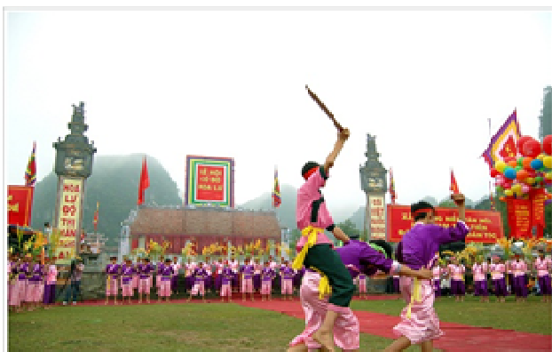
Hình 1.16. Tập trận cờ lau tại Lễ hội Hoa Lư

vẫn được lưu truyền từ xa xưa tới nay và là một trò chơi đặc sắc của trẻ em các phường: Tây Hoa Lư, Hoa Lư, Nam Hoa Lư của tỉnh Ninh Bình.