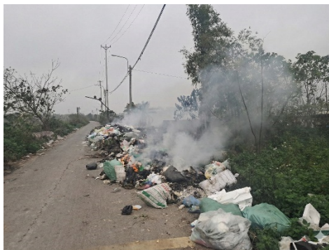
Hình 4.8. Đốt rác thải sinh hoạt tại một bãi rác ven đường

Khu vực đất canh tác tại một số làng nghề có dấu hiệu tích tụ kẽm, chì. Có nơi hàm lượng chì lên đến 27,8 mg/kg, hàm lượng kẽm lên tới 44 mg/kg. Nguyên nhân chính gây suy thoái đất là việc lạm dụng phân bón hoá học, thuốc bảo vệ thực vật trong nông nghiệp, các loại chất thải sinh hoạt, làng nghề và công nghiệp chưa được xử lý triệt để.