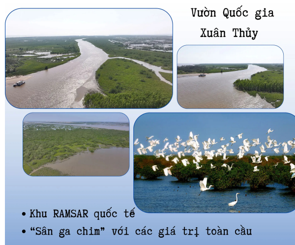
Hình 4.18. Vườn quốc gia Xuân Thủy và chim di cư

Ngư trường phong phú và hệ sinh thái đa dạng mang lại nguồn lợi thủy hải sản lớn, thúc đẩy ngành đánh bắt và chế biến.