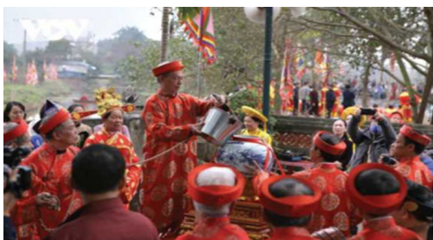
Hình 1.13. Nghi lễ rước nước, tế cá trong lễ hội Đền Trần