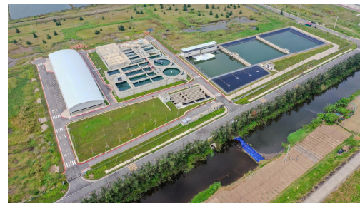
d. Hệ thống xử lý nước thải