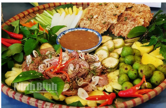
Hình 1.21. Cơm cháy, thịt dê