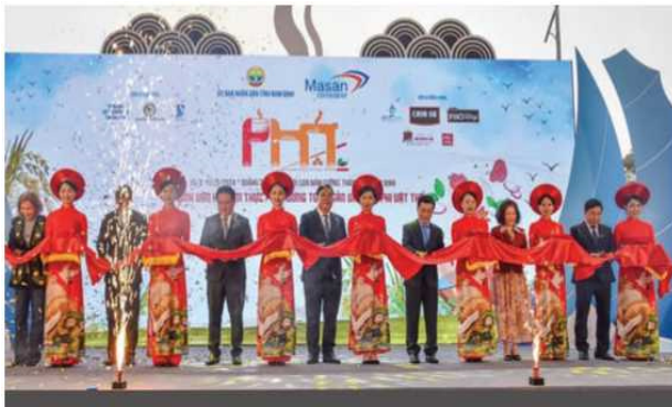
Hình 1.20. Các đại biểu cắt băng khai mạc Festival Phở