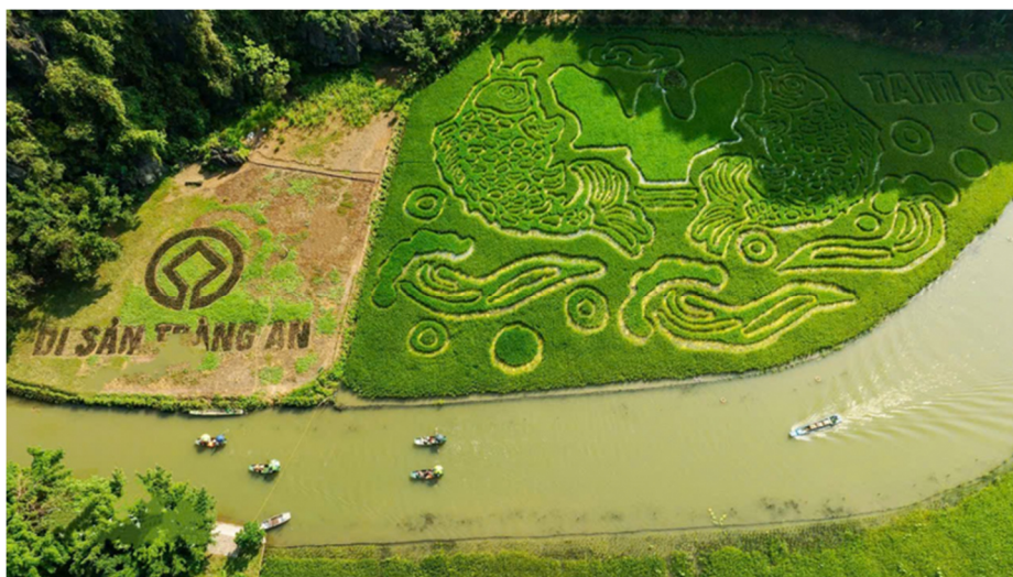
Hình 4.16. Di sản Tràng An

Quần thể danh thắng Tràng An (Ninh Bình) là di sản hỗn hợp (văn hoá và thiên nhiên) đầu tiên và duy nhất tại Việt Nam cũng như khu vực Đông Nam Á được UNESCO công nhận (2014), có diện tích 6 172 ha, nổi bật với cảnh quan đá vôi các-xơ, hệ thống hang động, sông ngòi và các giá trị khảo cổ tiền sử. Tràng An không chỉ là điểm đến du lịch sinh thái, tâm linh hấp dẫn mà còn là một “đấu chấm xanh” trên bản đồ du lịch thế giới, kết nối trong hành trình di sản miền Bắc. Đây là nguồn lực quan trọng để tỉnh Ninh Bình khai thác, phát triển công nghiệp văn hoá bền vững, hiệu quả trong thời gian tới.