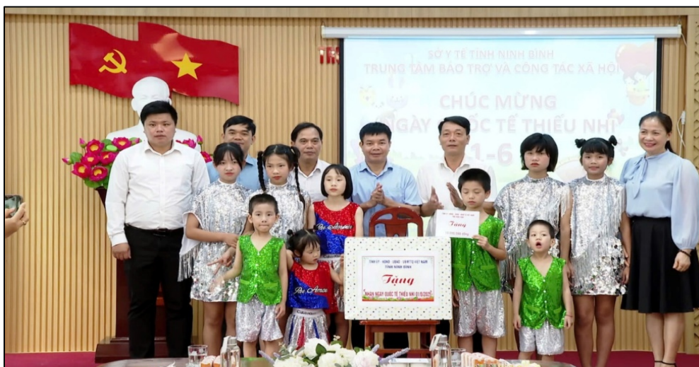
Hình 5.1. Tặng quà các cháu tại Trung tâm Bảo trợ và Công tác xã hội tỉnh nhân Ngày Quốc tế Thiếu nhi 01/6.

Em hãy xem đoạn video (theo đường link https://nbtv/video/chung-tay-xay-dung-quy-den-on-dap-nghia-va-an-sinh-xa-hoi ) rồi quan sát hình ảnh dưới đây và cho biết những chính sách an sinh xã hội nào của tỉnh Ninh Bình được đề cập đến trong đoạn video trên.