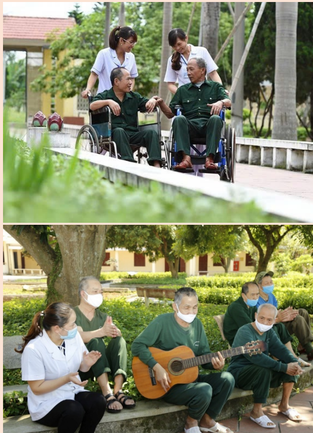
Hình 5.3. Trung tâm Điều dưỡng người có công tỉnh Ninh Bình

– Nghị quyết số 33/2025/NQ-HĐND ngày 09/12/2025 của Hội đồng nhân dân tỉnh Ninh Bình quy định về quà tặng đối với người có công với cách mạng, thân nhân liệt sĩ, người thờ cúng liệt sĩ, cơ sở nuôi dưỡng, điều dưỡng người có công nhân dịp Tết Nguyên đán, ngày Thương binh – Liệt sĩ (ngày 27/7), ngày Quốc khánh (ngày 02/9) hằng năm; hỗ trợ người có công với cách mạng, thân nhân liệt sĩ khi đi điều dưỡng tập trung tại các cơ sở điều dưỡng.