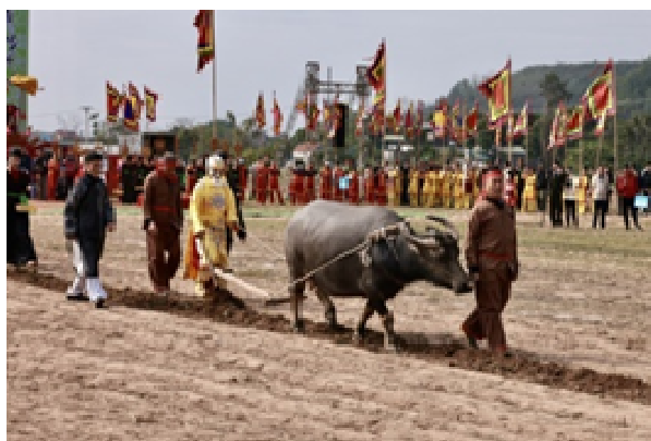
Hình 1.14. Lễ cày Tịch điền Đọi Sơn

Lễ hội Tịch điền Đọi Sơn (phường Tiên Sơn) được bảo tồn và gìn giữ qua nhiều thế kỉ. Lễ hội diễn ra vào ngày mùng 7 Tết hàng năm tại Phường Tiên Sơn, trở thành sự kiện văn hoá có ý nghĩa sâu sắc mỗi dịp Tết đến xuân về. Lễ hội nhằm tái hiện truyền thống “dĩ nông vi bản” của dân tộc, thể hiện sự coi trọng nông nghiệp, cầu mong mưa thuận gió hoà, mùa màng bội thu, đồng thời giáo dục lòng yêu lao động và ý thức gìn giữ bản sắc văn hoá cho các thế hệ sau.