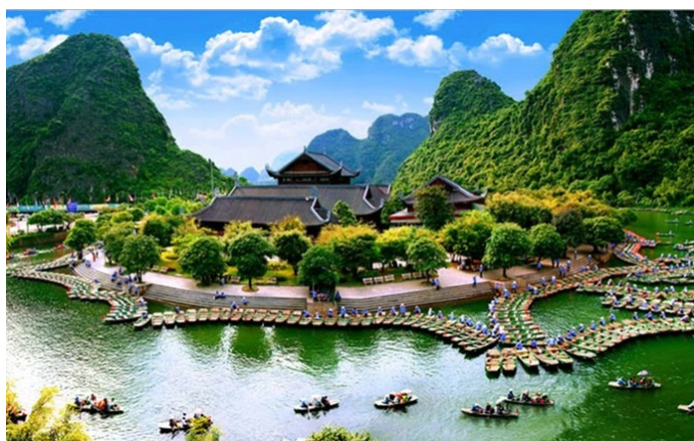
Hình 2.1. Di sản thế giới tổng hợp Tràng An – Bái Đính

Tỉnh Ninh Bình có nhiều tiềm năng phát triển du lịch với tài nguyên du lịch đa dạng, thuận lợi về vị trí địa lý và nhiều điều kiện kinh tế – xã hội để có thể phát triển nhiều loại hình du lịch.