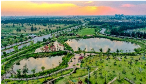
a. Khu công viên và hồ cảnh quan

Ví dụ tại Khu công nghiệp Dệt may Rạng Đông – Aurora IP (xã Rạng Đông), dự án có hạ tầng kỹ thuật xanh, hiện đại; hệ thống cung cấp nước mặt và xử lý nước thải công nghệ cao giúp tiết kiệm đến 40 % lượng nước trong quá trình nhuộm và đảm bảo 100 % chất thải được xử lý đạt chuẩn trước khi xả thải.