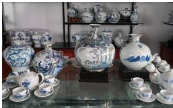
Hình 1.7. Nghề gốm Bồ Bát