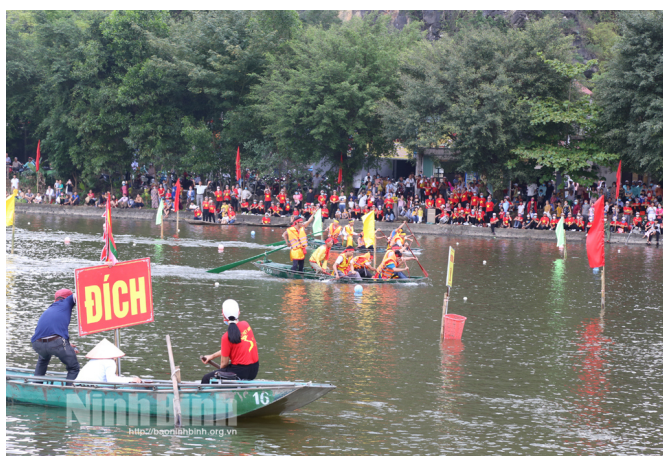
Hình 1.17. Trò chơi đua thuyền tại Lễ hội Hoa Lư