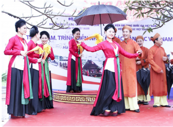
Hình 2.6. Văn nghệ dân gian – Chiếng chèo Nam