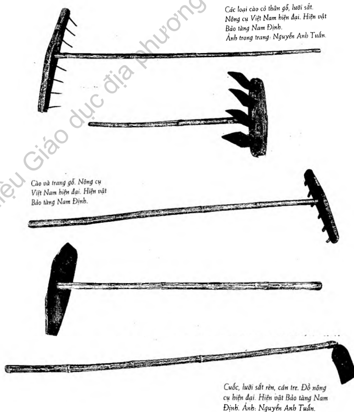
Những dụng cụ cho nghề trồng lúa nước