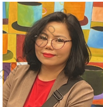
Nhà thơ Bình Nguyễn Trang

Tác phẩm đã xuất bản, gồm 4 tập thơ: Lối về (1995), Chỉ em và chiếc bình pha lê biết (2003), Những bông hoa đang thien (2012), Những người đàn bà trở về (2016) và 06 tập văn xuôi: Chuyến tàu thời gian (Truyện, 2000), Sông của nhiều bờ (Kí chân dung, 2012), Tìm trong cõi người (Kí chân dung, 2012), Mùa đom đóm mở hội (Tập truyện ngắn, 2013), Hoa gạo cuối trời (Tản văn, 2016), Sống mãi trên quê hương anh hùng (Truyện kí, 2020).