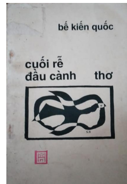
Tập thơ “Cuối rẽ đầu cành”