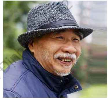
Nhà thơ Phạm Công Trứ

Bài thơ Ba đoạn thơ thu được rút ra từ tập Lời thì cỏ may . Trong đó Đoạn thơ thu thứ nhất thể hiện rõ nét sắc thu và giọng tự cảm nguì nguì của hồn thơ Phạm Công Trứ.